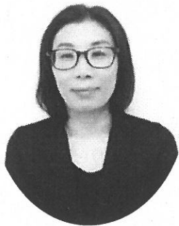
かとう あきこ 講師 加藤 陽子 氏